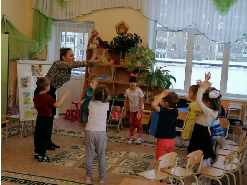
(Дети возвращаются на стульчики.)

- Молодцы. В каждой семье случаются праздники. Какие праздники вы отмечаете всей семьей? (Ответы детей: день рождения, Новый год и т.д.)