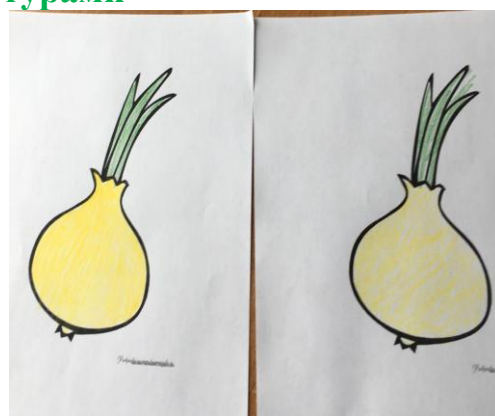
Рисование «Лук от всех недугов»