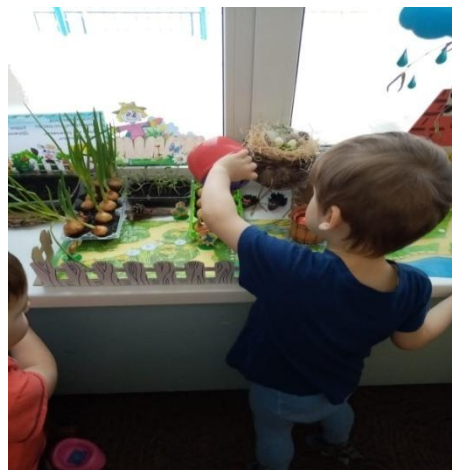
Полив, уход и наблюдения за овощными культурами