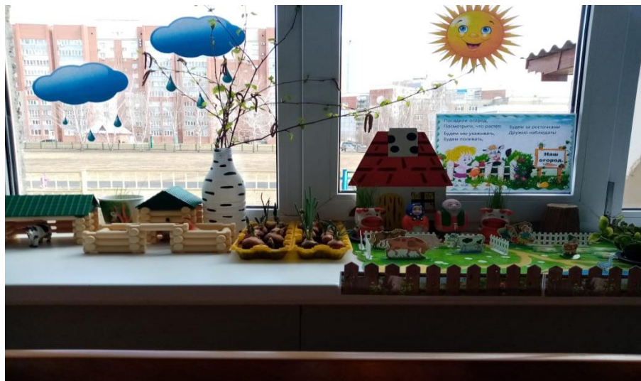
Анализ и обобщение результатов, полученных в процессе исследовательской деятельности детей.