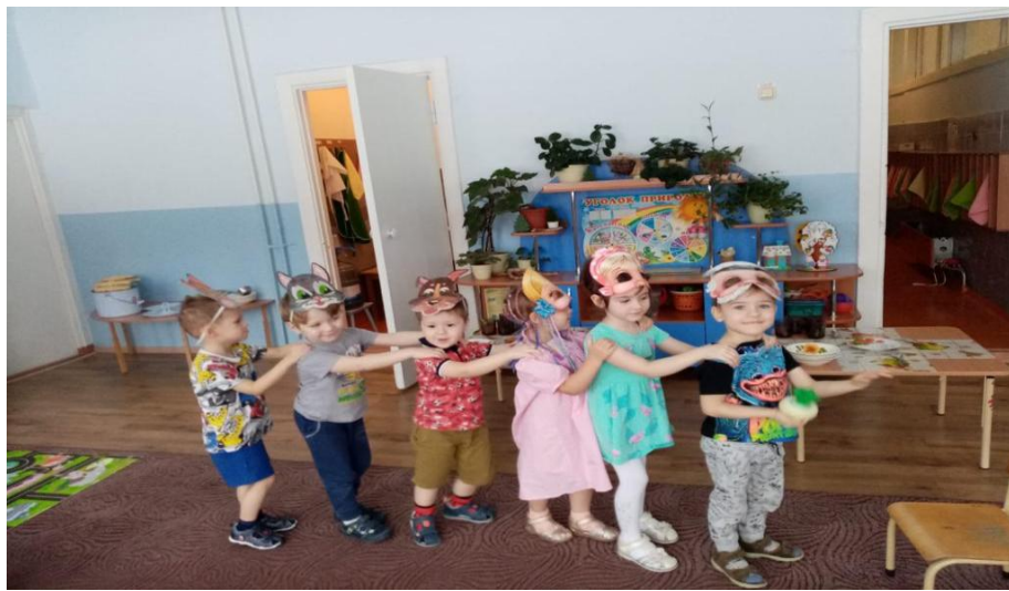
Инсценировка сказки «Репка»