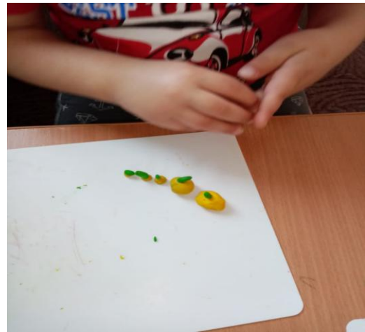
Лепка «Овощи большие и маленькие»